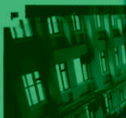
DMC 数控技术 训练场所